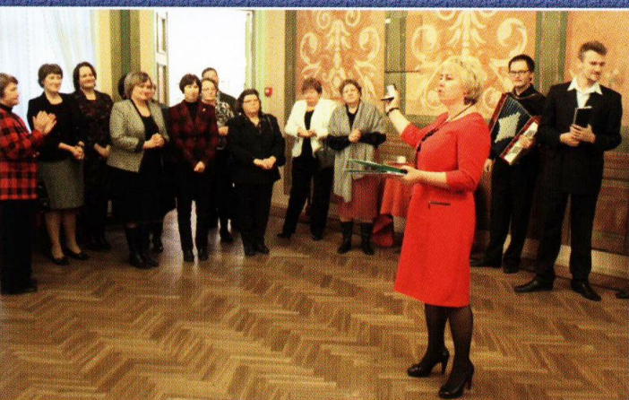
Награждение активных членов Общества преподавателей русского языка и литературы Эстонии